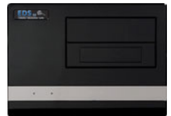
Abb. EDS-Appliance kann abweichen